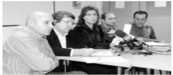
Los representantes de los sindicatos, durante el contacto de ayer con los medios de comunicación.