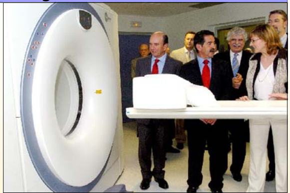
Día de la inauguración hace más de dos años con bombo y platillo de un equipamiento que aún hoy no funciona y además se privatiza.

Exigimos a nuestros responsables políticos, que aborten éste, a nuestro juicio, "ruinoso negocio" para nuestro hospital y Comunidad Autónoma y en definitiva para la Sanidad Pública. y se depuren las responsabilidades que entendemos existen en este caso. ¿Por qué se privatiza la Alta Tecnología del SCS?