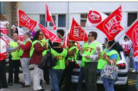
Delegados Sindicales de UGT en las concentraciones convocadas para la consecución del II grado de desarrollo profesional el pasado mes de junio

A UGT no nos valen las excusas que nos pone la administración; En la pagina siguiente os hemos colocado la comparativa de retribuciones en materia de desarrollo profesional entre CCAA y en la que se aprecia clarísimamente que de no aprobarse en Cantabria el III y IV grado de desarrollo profesional, como tenemos firmado, quedaríamos relegados retributivamente a los últimos lugares de España y eso UGT no lo va ha consentir en Cantabria.