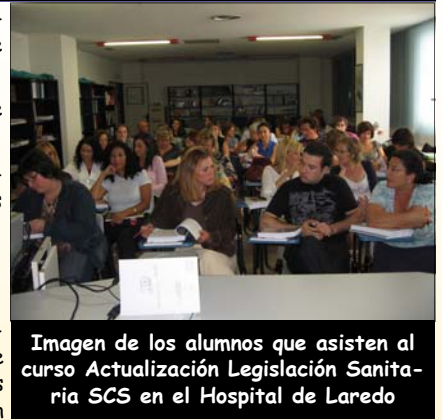
Imagen de los alumnos que asisten al curso Actualización Legislación Sanitaria SCS en el Hospital de Laredo

4 celadores en urgencias: 3 dentro, 1 en puerta. 4 para planta están ubicados en la 1ª planta, de este modo el recorrido al realizar los diversos servicios les queda más cerca. La mayoría están contentos con