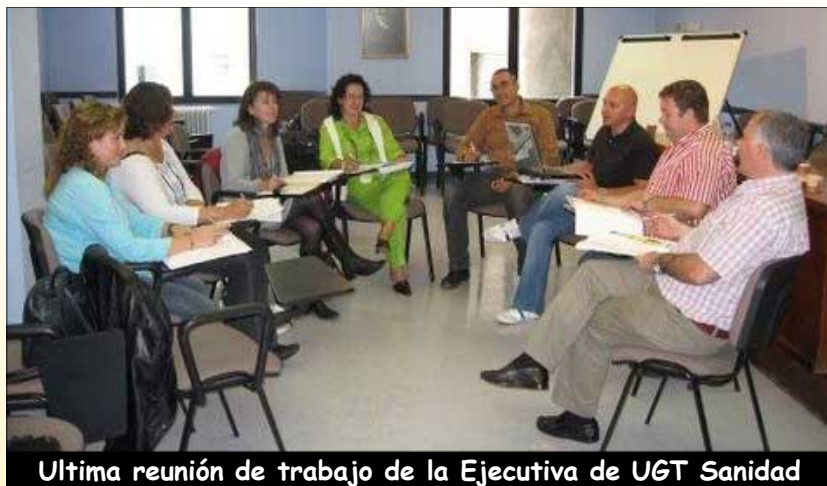
Ultima reunión de trabajo de la Ejecutiva de UGT Sanidad

Ya va para 2 años desde que se firmo el acuerdo de selección de personal estatutario temporal del SCS, y nuestros gestores del SCS son tan inútiles e incompetentes que no han sido capaces de sacarlo adelante, y a este paso dudamos que lo hagan en su totalidad antes de que expire su vigencia que es de 3 años. A día de hoy solo 2/3 de las especialidades médicas y la primera convocatoria de médicos de familia y celadores tienen listados definitivos. (pero no están funcionando) El resto, están con listados provisionales (24) y en algunas categorías ni siquiera eso, tan solo han sido publicadas las listas de admitidos y excluidos (30). Para