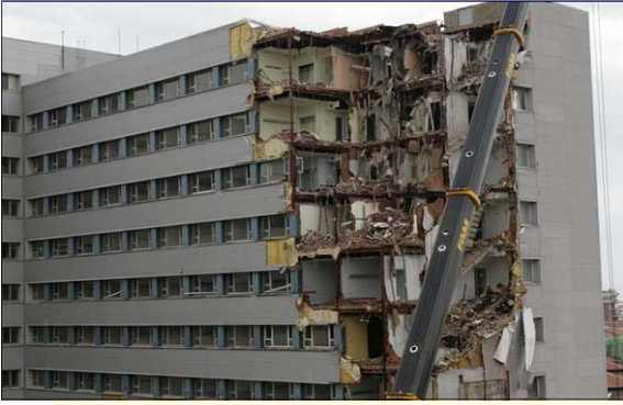
La demolición se ha hecho en tiempo record