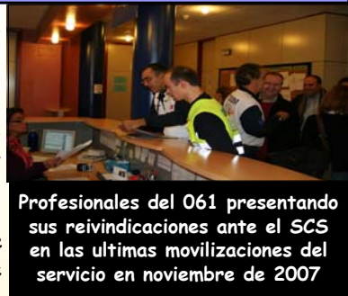
Profesionales del O61 presentando sus reivindicaciones ante el SCS en las últimas movilizaciones del servicio en noviembre de 2007