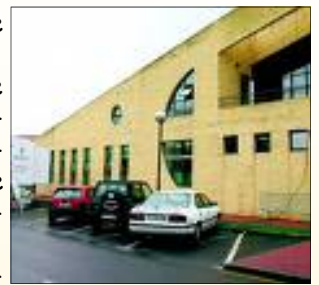
El verano ha sido duro en la Atención Primaria de Cantabria

Y todo esto gratis total, sin reconocer la Gerencia en ningún momento que aquí hay un problema muy serio incluso hemos escuchado recientemente a la Directora de gestión que los titulares pedimos mal los permisos y como estamos en crisis económica han tenido la idea de nombrar una Subdirectora de gestión para solucionar el problema isigan nombrando cargos: con el dinero que se ahorran en pagar a sustitutos y a titulares que realizan cargas de trabajo muy superiores a lo humanamente posible aumentaremos las arcas del SCS y la prevalencia del burnout.