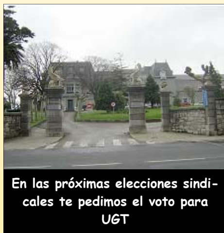
En las próximas elecciones sindicales te pedimos el voto para UGT

En Septiembre acaba el mandato de 4 años del Comité de Empresa del hospital Santa Clotilde y comienza el preaviso del nuevo proceso electoral que comenzara en octubre. Actualmente los delegados son mayoritariamente de UGT ( 5 de 9 delegados que conforman el comité).