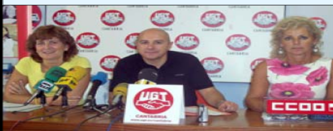
UGT, CSIF Y CCOO pidiendo la aplicación del EBEP

UGT PIDE LA INTEGRACION DEL PERSONAL DEL " HOSPITAL DE CAMPOO " EN EL SCS