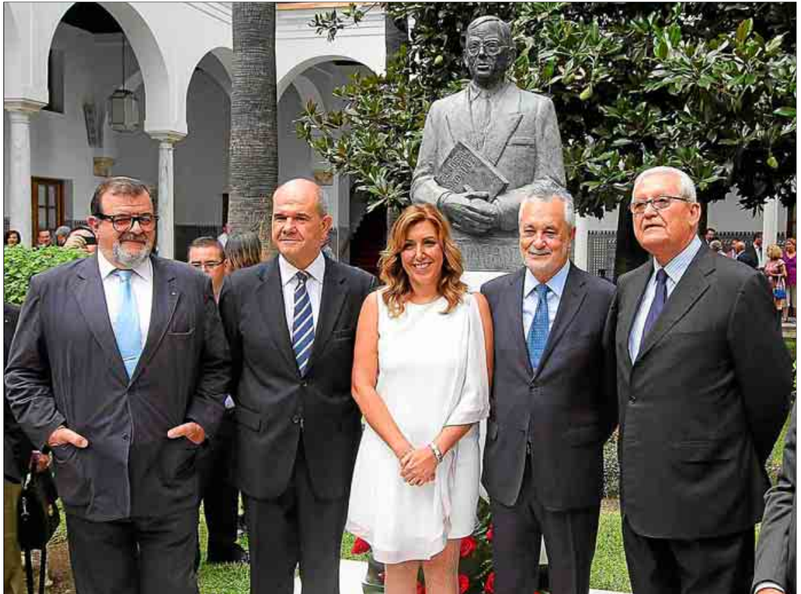
Susana Díaz posa en su toma de posesión en septiembre de 2013 con los ex presidentes de la Junta ante el busto de Blas Infante.

Aunque este diario ha publicado las resoluciones firmadas por varios