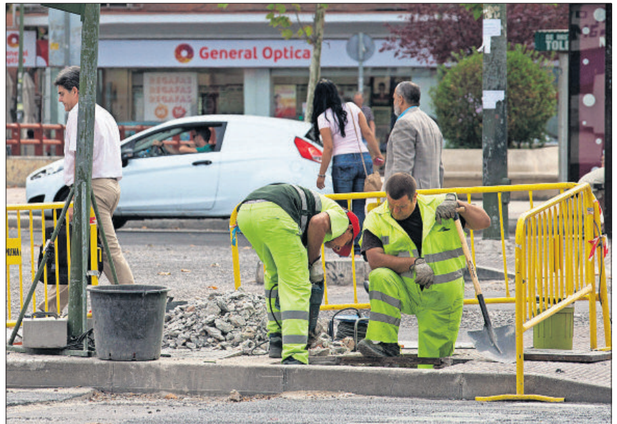
Dos obreros trabajan en la calle Arturo Soria de Madrid.

La duración media del desempleo prácticamente se ha duplicado en el último año. Entonces, encontrar trabajo costaba 9,2 meses; hoy son 17,3 (un aumento del 88%, ligeramente superior a la media nacional, que ha crecido un 83%). El director del informe señala una multitud de causas para explicar una situación que califica como "terrible" y hace especial énfasis en el aspecto psicológico: "Una persona que lleva dos años parada está muy tocada y