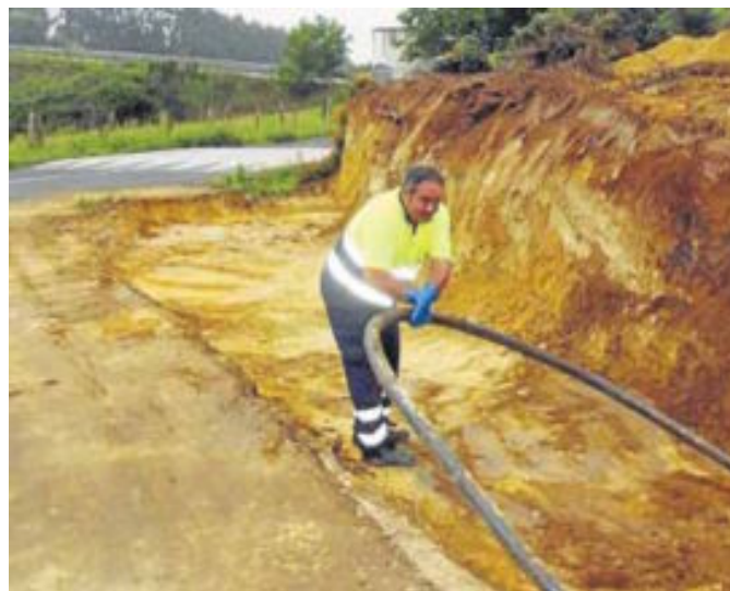
Lugar en el que se produjo el suceso. ✪ L. A.

El pueblo de Valdáliga se encontraba ayer consternado ante el suceso. La obra en la que se encontraba trabajando alcanza en este momento su tercera fase y ha sido duramente criticada por la oposición en el Ayuntamiento al considerar que se trata de un «despilfarro». «Era un hombre joven y muy conocido en el pueblo. Estamos muy afectados», explicó ayer el alcalde en el lugar del accidente.