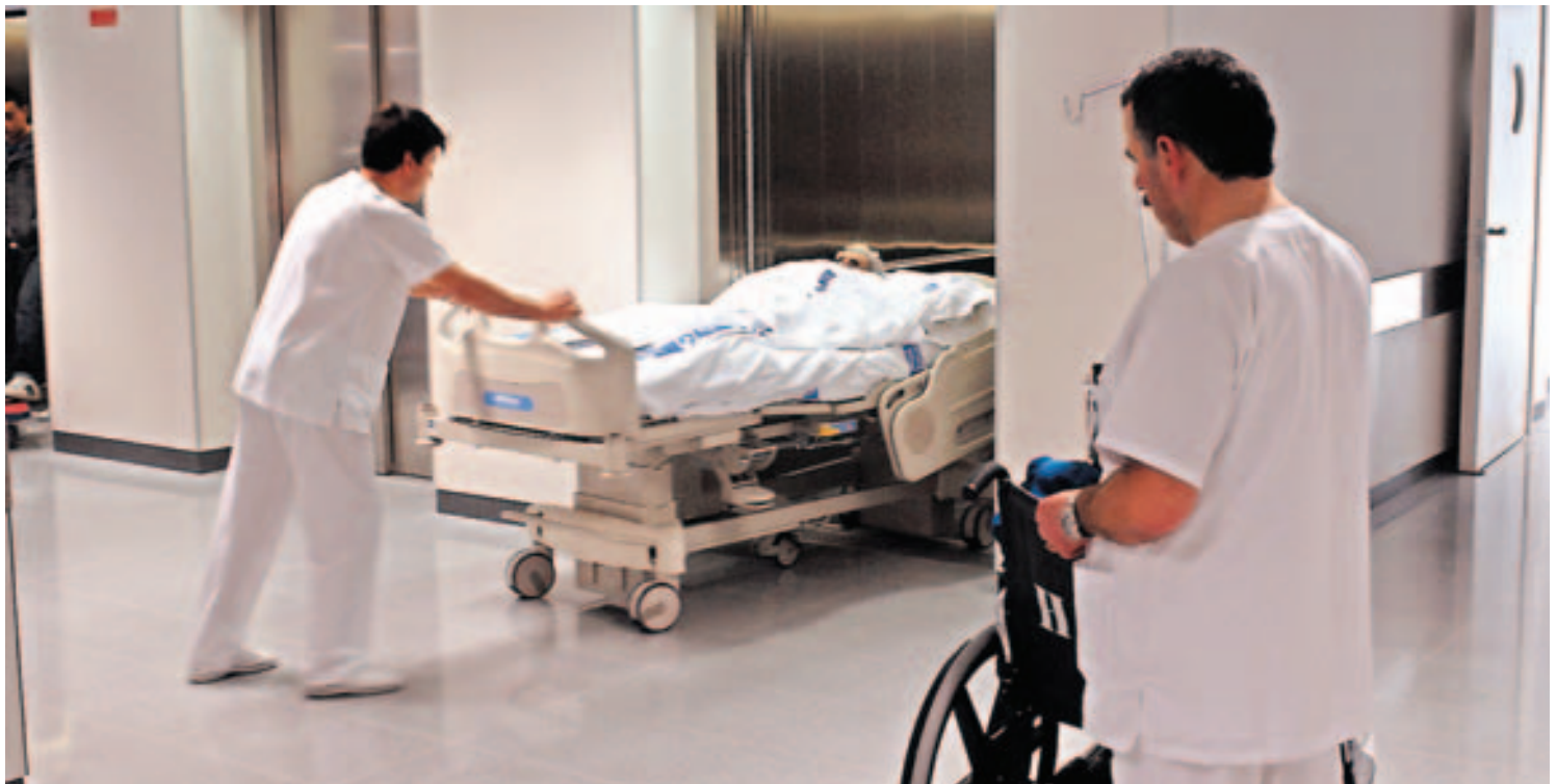
Personal sanitario introducen a un paciente en uno de los ascensores del Hospital San Pedro. :: L.R.

El PP replicó aconsejando a los dirigentes riojanos del PSOE que trasladen sus sugerencias y recomendaciones a comunidades como Andalucía, que «sí presenta graves problemas en materia de sustitución de jubilaciones o de cierre de camas». Sus datos indican que los hospitales andaluces hay 3.000 camas cerradas, lo que supone el 20% de la actividad hospitalaria.