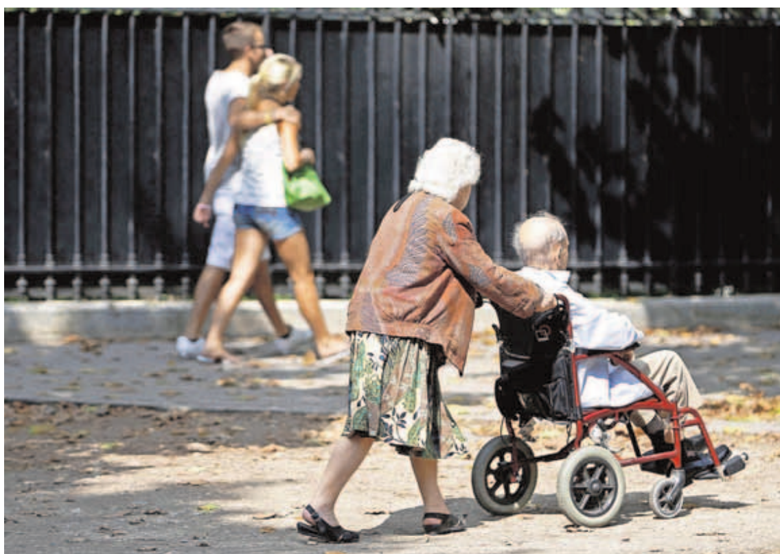
Una mujer mayor se encarga de su marido, que necesita silla de ruedas.

pendiente en casa. A cambio, crece en 2.030 la prestación vinculada desde los 15.913 solicitantes de hace dos años. Solo en los últimos cinco meses de este año ha aumentado en 986. Así, mientras actualmente el 70% de los dependientes de Castilla y León opta por servicios -directamente residencias o centros de día o costeados con la ayuda administrativa- frente al 30%