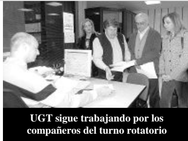
UGT sigue trabajando por los compañeros del turno rotatorio

¡Como los del anuncio...! y siguen, y siguen y siguen. Sra. Consejera ¡No se nos olvida el DECRETAZO DE JORNADA! y como es un asunto injusto que perjudica a 2.300 compañeros, seguiremos recordándole que hay que ponderar el turno rotatorio con una valoración de jornada de 1.460 horas anuales, además