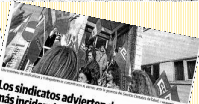
Una treintena de sindicalistas y trabajadores se concentraron el viernes ante la gerencia del Servicio Cantabro de Salud.

Mientras las organizaciones sindicales convocabantes de la huelga consideran que la participación de los trabajadores fue notable, fuentes oficiales de la Consejería de Sanidad, sostienen que el seguimiento ha sido limitado y apenas ha provocado alteraciones asistenciales.