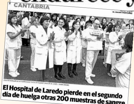
El Hospital de Laredo pierde en el segundo día de huelga otras 200 muestras de sangre