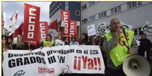
Con la firma de este acuerdo termina la implantación de la Carrera Profesional para todo el personal del SCS

¡ LA HUELGA GENERAL EN EL SCS DIO SU FRUTO ! FIRMADO Y APROBADO EL ACUERDO DE DESARROLLO PROFESIONAL EN EL SERVICIO CANTABRO DE SALUD. Inminente apertura del plazo de solicitudes de grados III y IV