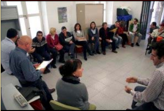
Asamblea de trabajadores convocada por UGT en Castro Urdiales

La Supresión del Servicio de Urgencias 24 horas de Castro Urdiales, Ha sido el primer movimiento de la Gerencia del SCS, para iniciar un proceso de reestructuración de la atención primaria en Cantabria.